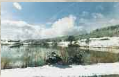
Union Cycliste Hauteville Albarine Valromey Centre Social - 01110 HAUTEVILLE LOMPNES