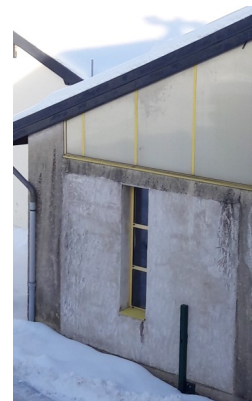
Façade SUD salle polyvalent