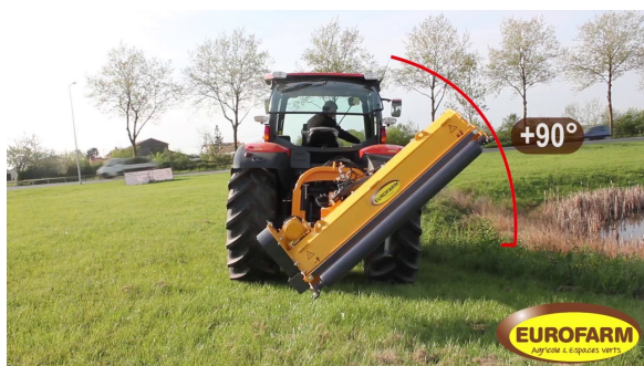
Exemple d'un broyeur d'accotement

PC n° 0001 : Mr TENAND Patrice (Rougemont) : Extension de son bâtiment garage pour un abri bois.