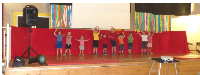
La classe des maternelles en démonstration.

La fête de l'école s'est déroulée à la salle polyvalente d'Aranc sur le thème du cinéma.