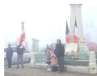
Dépôt de gerbes à la stèle et aux monuments aux morts par le Maire accompagné d'enfants de la commune et d'élus.

Comme chaque année, la municipalité a commémoré l'anniversaire de la journée du 7 février 44.